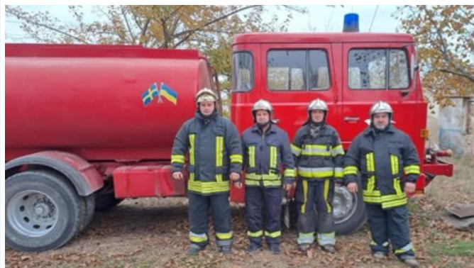
Gammalsvenskbyns nya brandvagn

I november träffades Gotland och Beryslav i samband med en ICLD-konferens i Bryssel. De besökte då EU-kommissionen och EU-parlamentet och gavs insikter om Rysslands desinformation och Ukrainas väg mot EU-status.